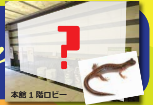
本館 1 階ロビー

01. 茨城県の絶滅危惧種「ツクバハコネサンショウウオ」の 巨大迷路に挑戦しよう! 《13:30よりお披露目除幕式》 『ツクバハコネサンショウウオ“ミニ迷路”森のタンブラー』数量限定販売! 茨城県や筑波山系の生物多様性保全のため、森のタンブラーの売り上げの一部を寄付します