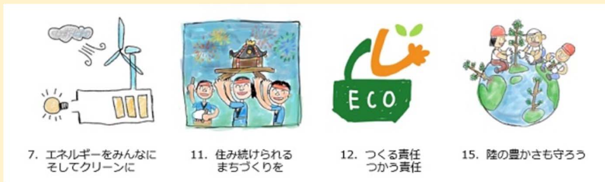
7. エネルギーをみんなに そしてクリーンに