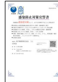
感染防止対策宣誓書 （いばらきアマビエちゃん）と 接客ブースのパーティション