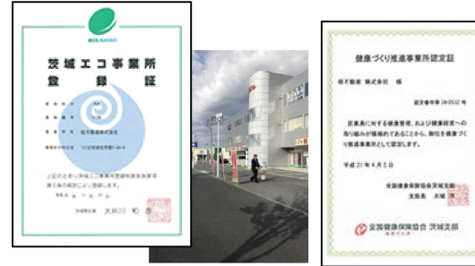
茨城エコ事業所認定証と 清掃活動の様子